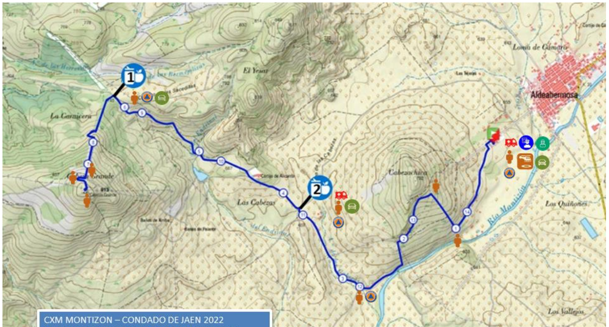
CXM MONTIZON – CONDADO DE JAEN 2022 MEDIOS DE CARRERA Y PLAN DE SEGURIDAD Y EMERGENCIAS. PRUEBA MINITRAIL.